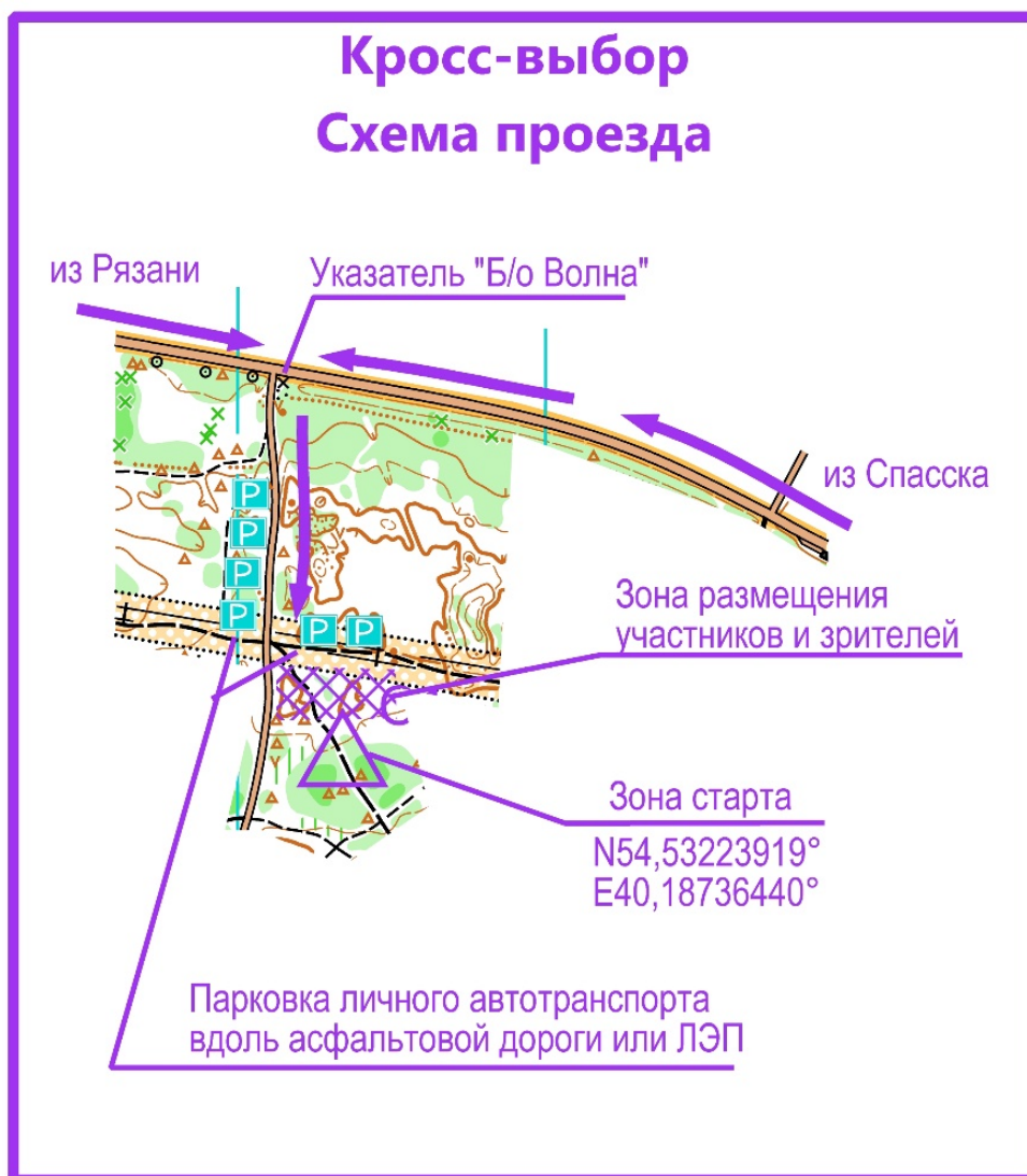
Схема проезда к зоне старта

Местность представляет собой коренной склон долины р. Ока с участками, насыщенными мелкими формами рельефа. Местами склон прорезан