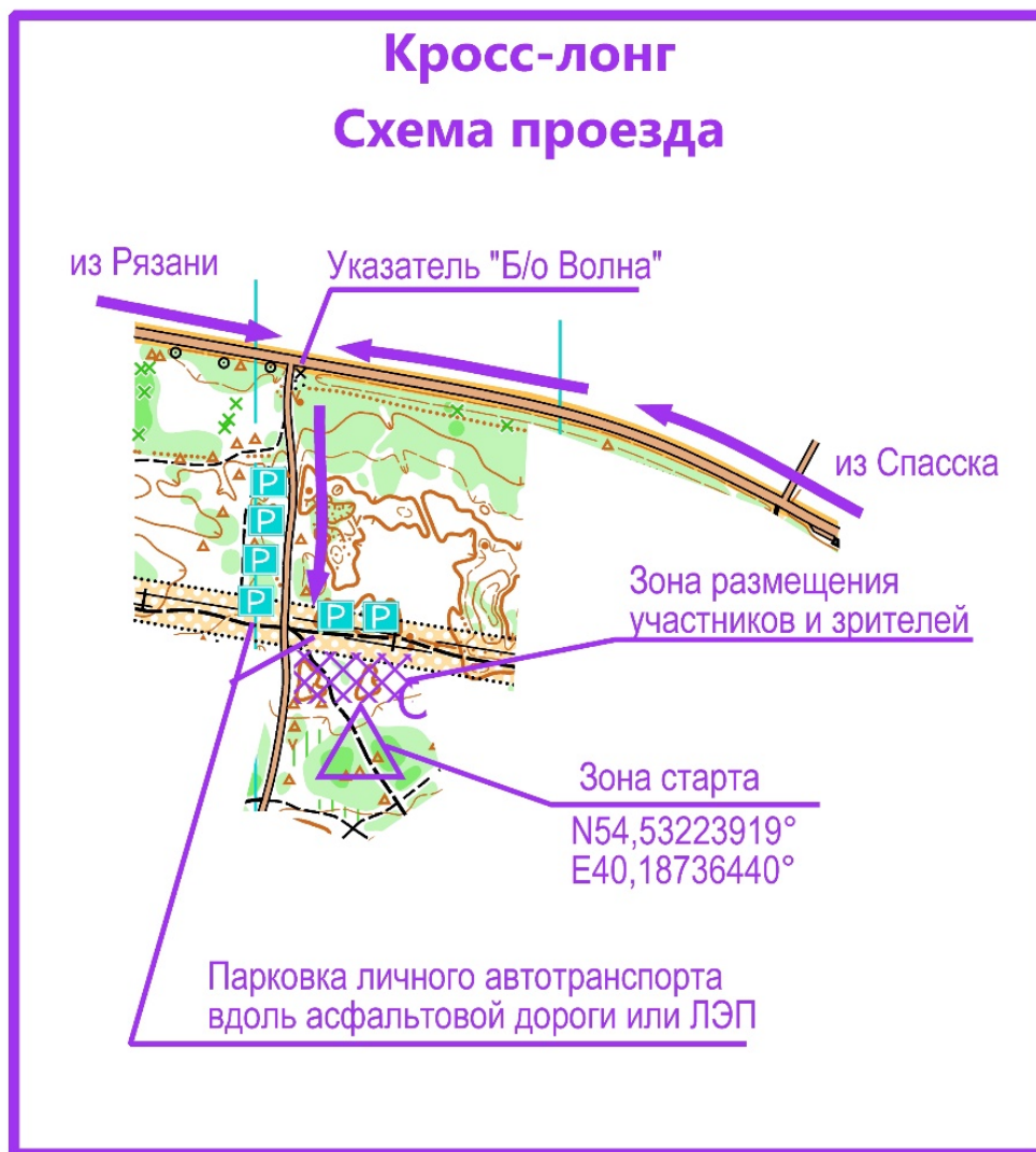
Схема проезда к зоне старта дисциплины «кросс-лонг»

Местность представляет собой коренной склон долины р. Ока с участками мелкосопочного рельефа, представленного преимущественно положительными формами. Перепад высоты на склоне 10-20 метров. Склоны пересекают овраги глубиной до 5 метров. Грунт песчаный. Местность закрытая на 90%. Лес сосновый, с включениями лиственного. Проходимость от хорошей до труднопроходимой. Сеть троп и дорог развита очень хорошо.