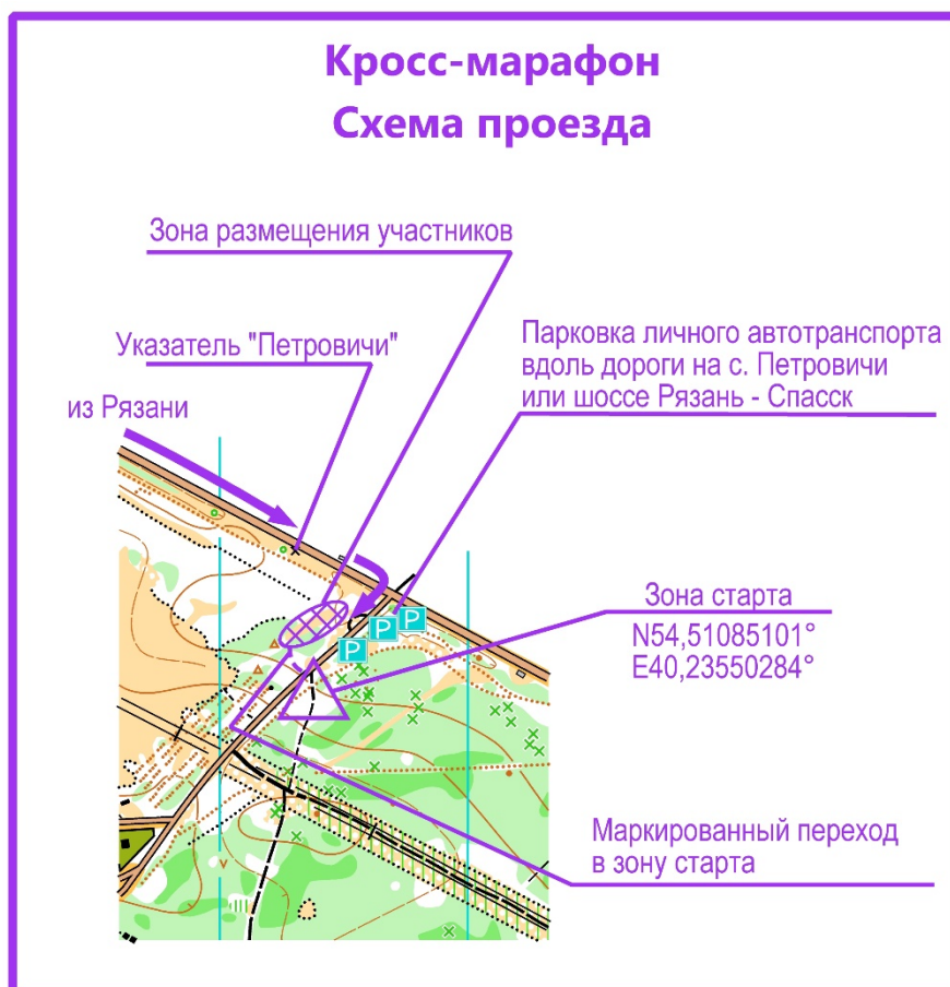
Схема проезда к зоне старта дисциплины «кросс-марафон»

К зоне старта дисциплины «кросс-марафон» проезд личным транспортом до поворота на с. Петровичи Спасского района. Парковка транспорта вдоль дороги к с. Петровичи и шоссе Рязань - Спасск. Для участников будет организован трансфер.