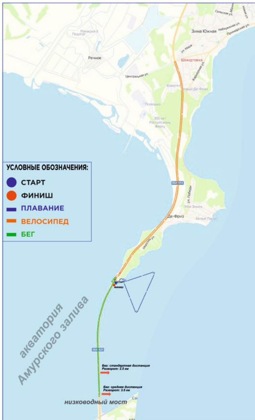
СХЕМА ДИСТАНЦИИ ТРИАТЛОН «ДЕ-ФРИЗ 113»