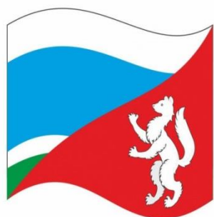
Федерация спортивного ориентирования Свердловской области