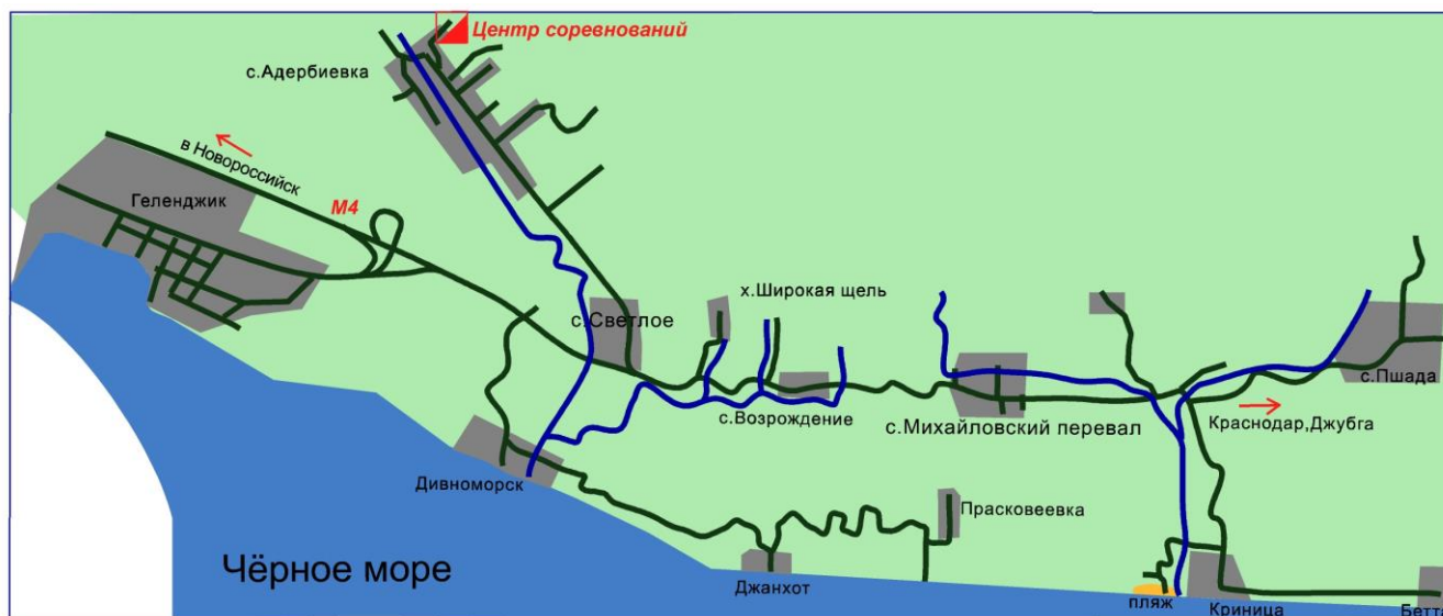
Схема центра соревнований "Золотая Осень - 2017"