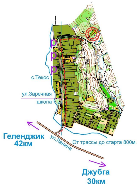
СХЕМА Центра соревнований 14-15.05