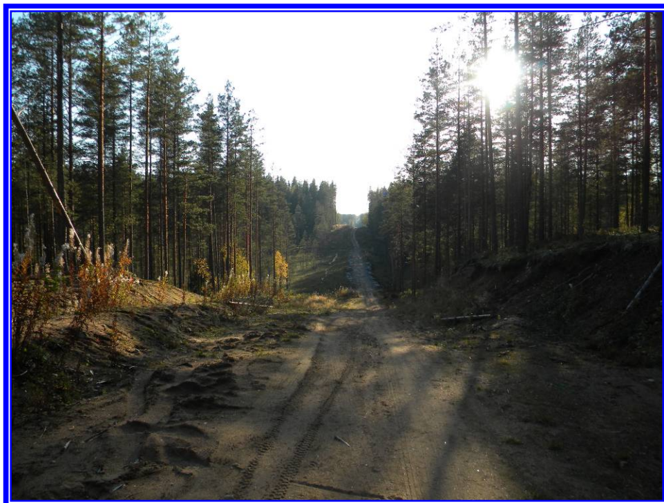
Фото из района